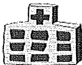
災害医療支援病院