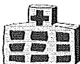
災害医療支援病院

■軽症・中等症患者の受入や災害拠点病院へ医師派遣等を行う医療機関を「災害医療支援病院」として見独自に指定