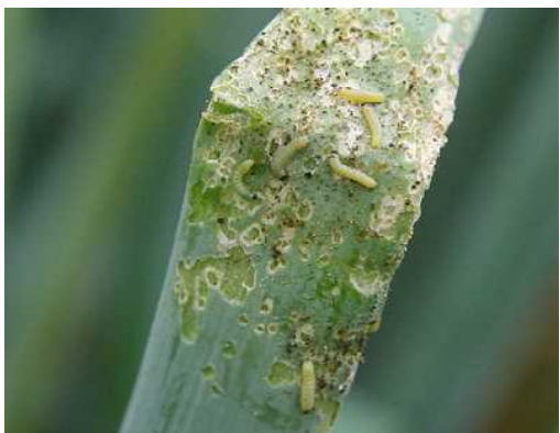
図4 ネギを加害する幼虫