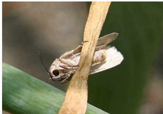
図3 シロイチモジヨトウ成虫