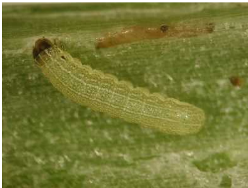
図2 シロイチモジヨトウ幼虫

ネギでは、幼虫が葉身内に食入し、内部から外皮を残して食害するため、被害株は葉身の先端部がかすり状になる。豆類では葉裏から表皮を残してかじり、白変葉になる。花き類では、生育初期に葉鞘に食入するため展葉した葉がすでに食害を受けていることがある。