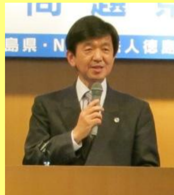
池本先生による講演