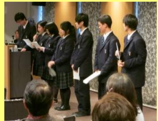
城西高校生による発表