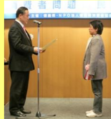
くらしのサポーター活動功労者表彰