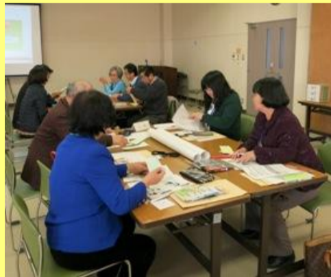
くらしのサポーター研修会