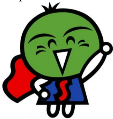
「消費者教育推進大使」 すだちくん

http://www.pref.tokushima.jp/shohi/supporthp/