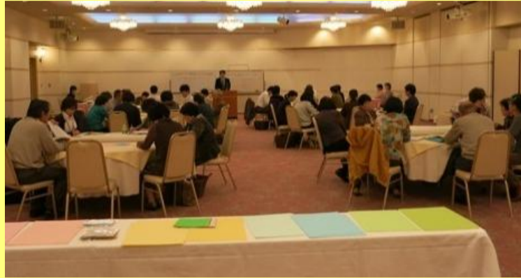
くらしのサポーター・ 消費生活コーディネーター 交流会