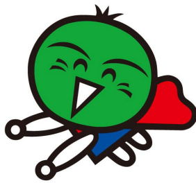
「消費者教育推進大使」 すだちくん

http://www.pref.tokushima.jp/shohi/supporthp/