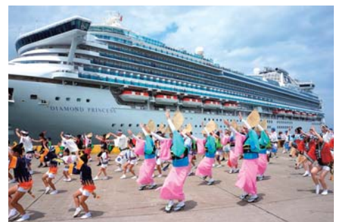
【クルーズ客船の寄港の様子】

外国クルーズ客船の寄港促進による観光誘客を図るため、徳島小松島港の保安対策等受入れ態勢の整備やクルーズ客船に係る係船料の支援等を実施する事業