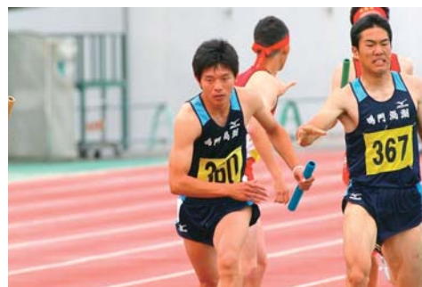
【スポーツパークで力走する陸上部】

徳島県の未来のトップアスリートを発掘・育成・強化するため、鳴門渦潮高校や鳴門・大塚スポーツパークを中心に、県内のスポーツ拠点施設と相互に連携しながら、各施設の特徴を活かして、試合・講習会等を展開する事業