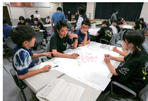
【農工商3校合同「商品開発ミーティング」】

「6次産業化をプロデュースする人材」を育成するため、農業、工業、商業科設置高校が連携し、それぞれの専門分野を活かし、生産から加工、販売に関する実践的な教育を推進する事業