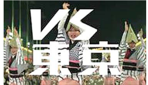
【徳島魅力満載のPR動画】

共通コンセプト「vs東京」に基づき、徳島ならではのコンテンツを活用し、その魅力を高めるため、本県の有する東京にも勝る魅力を国内はもとより、世界へ向けて発信する事業