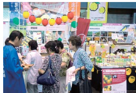
【物産展での県産品PR】

「とくしま県産品振興戦略(第2期)」に基づき、県産品の振興による地域産業の活性化を図るため、県内での消費拡大と、アンテナショップでの認知度向上・販売促進を推進する事業