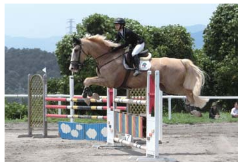
【育成プログラムの活用（馬術）】

県出身選手が全国大会や国際大会で活躍できるようにするため、優れた素質を有するジュニア競技者を発掘し、トップレベルの競技者へと育てる一貫指導システムを構築するとともに、トップ指導者を養成する事業