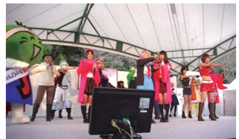
【「マチ★アソビ」イベントの様子】

国内外からさらなる観光客を誘致するため、クールジャパンの代名詞である「アニメ」を活用し、「マチ★アソビ」等の充実開催を行うとともに、その魅力を海外に向けて情報発信をする。また、大鳴門橋を利用した関西方面からの誘客を促進するため、大鳴門橋開通30周年イベントを同時に開催する事業