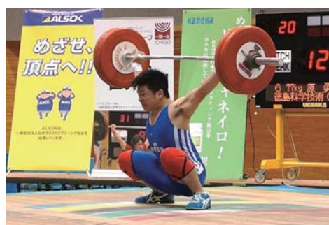
【ウェイトリフティング部の試合風景】

高等学校において、特色を持った「トップスポーツ校」を指定し、学校の特徴を活かし競技団体や地域諸団体との連携等により各競技種目の競技力向上と振興を推移し、全国大会において上位入賞ができる運動部を育成する事業