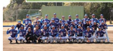
【プロスポーツの様子】