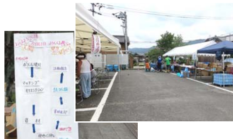
【災害ボランティアセンターの様子】

今後の大規模災害発生に備え、災害ボランティアの募集や受入、コーディネートを行う「災害ボランティアセンター」の円滑な立ち上げ、運営に向けた実効性の高い支援を行う事業