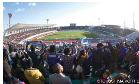
【徳島ヴォルティスの応援】

J1効果を継続的なものとするため、徳島県民デー等の実施により、全県的な応援の機運を醸成するとともに、シャトルバスの運行等による渋滞緩和対策や、アウェイサポーター向けの観光情報発信等を行う事業