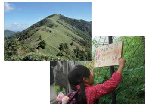
【剣山国定公園とネイチャースクールの様子】

「日本一安全・安心な山！剣山」を目指し、「地域の宝」として次世代に継承していくため、登山道の点検やマナーアップキャンペーンを実施するとともに、「山の日」を制定等を契機とした剣山イベントの情報発信を行う事業