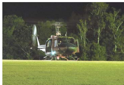
【自衛隊ヘリの夜間搬送訓練】

広域的取組みである実践的な防災訓練や防災啓発を軸に地域防災力を向上させるため、自衛隊ヘリを活用した夜間搬送訓練や、医療関係機関と連携した南部圏域防災訓練を実施するとともに、戦略的な災害医療体制の構築を図る事業