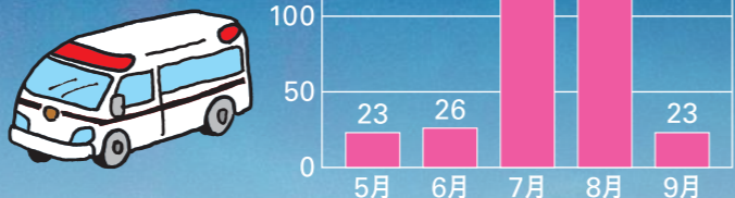
平成28年徳島県内の熱中症による搬送者数

高温の環境下で、体内の水分や塩分のバランスが崩れたり、体内の調整機能が破綻するなどして発症する障害の総称です。最悪の場合、死に至る可能性もあります。徳島県も、昨年7・8月には344人が熱中症で救急搬送されています。正しい予防法を知って熱中症を防ぎましょう。*