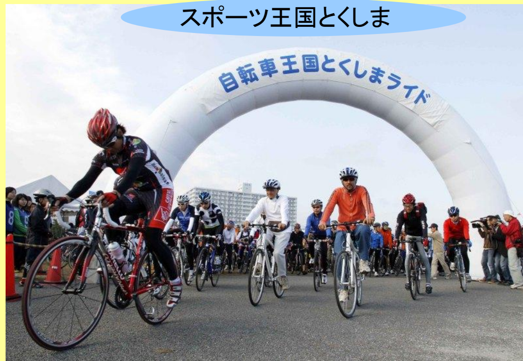
自転車王国とくしま サイクルスポーツイベント