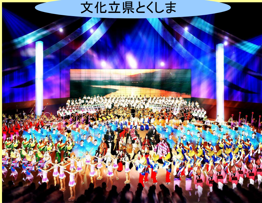
国民文化祭 総合フェスティバル(開催イメージ)