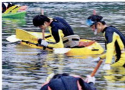
■徳島科学技術高校のウニの駆除