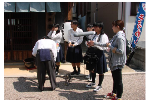
■美馬商業高校の短編映画の制作