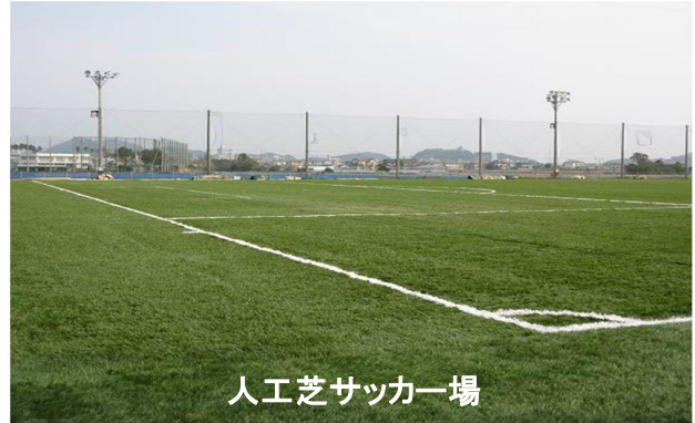
人工芝サッカー場