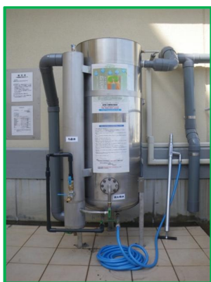
ろ過装置付き雨水タンク

平成23年度は 富岡東高校と海部高校を モデル校として実施 平成24年度は 城東高校など11校 平成30年度までに すべての県立学校で実施