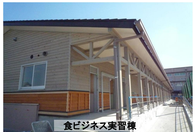
食ビジネス実習棟