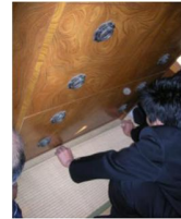
家具転倒防止 器具の設置