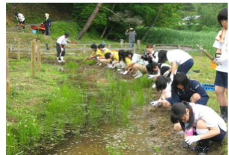
■三好高校のサギソウ保護増殖活動