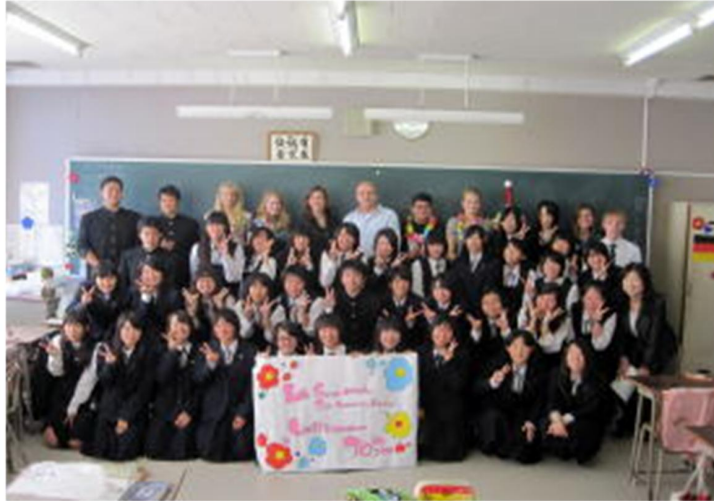
ドイツ・ニーダザクセン州BBSシエーラベルク校訪問団と 徳島商業高校の交流