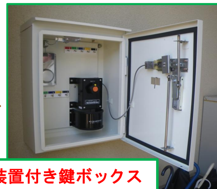
地震自動解錠装置付き鍵ボックス