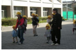
幼稚園児を伴っての避難訓練