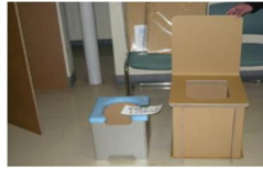
簡易トイレの作成