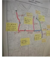
ハザードマップの作成