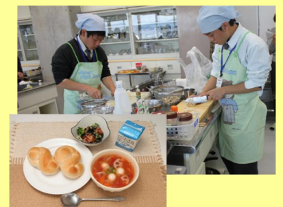
高校生による学校給食アイデア料理コンテスト