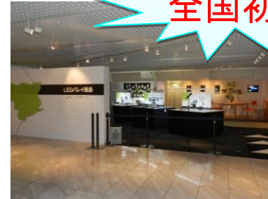
LED製品常設展示場 (新宿 H23.11月開設)