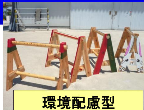
環境配慮型 木製バリケード