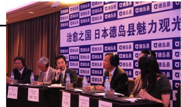
とくしま経済飛躍サミットin上海