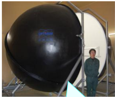
公設試で国内最大