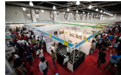
日中ものづくり商談会