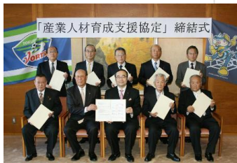
「産業人材育成支援協定」締結式