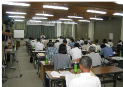
集落営農組織の育成支援