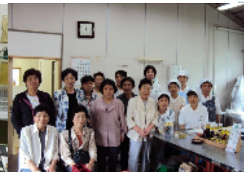
農村女性の加工開発支援