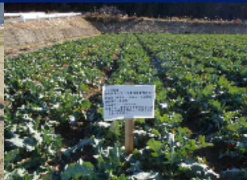
ブロッコリー品種比較試験