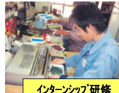
インターンシップ研修