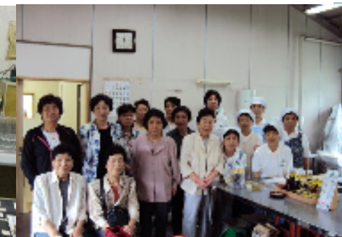
農村女性の加工開発支援