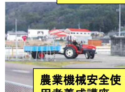
農業機械安全使用者養成講座