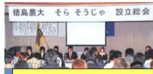
模擬会社「そらそうじゃ」