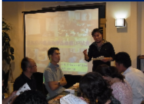
青年農業者の活動支援