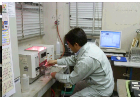
土壌分析による施肥改善