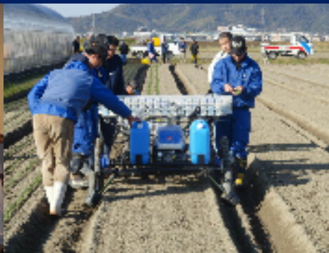
タマネギ移植機実演会