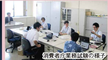
消費者庁業務試験の様子