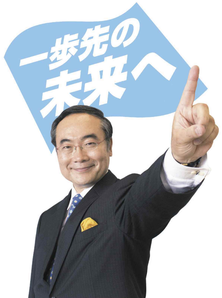
徳島県知事 飯泉 嘉門

「可能性の宝庫・徳島」の魅力をもう一段高い次元へ進化させるとともに、課題解決の処方箋を徳島から全国に発信し、地方創生、ひいては日本創成を実現する「とくしま回帰」の流れを創出することにより、全国に先駆けた「一歩先の未来」を県民の皆様とともに歩み、世界に“新しい価値観”を発信する「オンリーワン徳島づくり」を進めます。