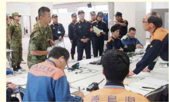
徳島県総合防災訓練