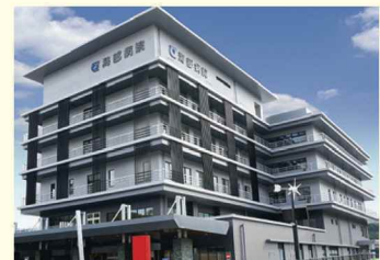
新海部病院(高台移転)