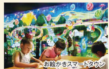
川口ダム自然エネルギーミュージアム(映像展示室)