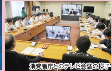
消費者庁とのテレビ会議の様子