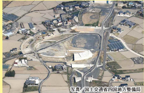
写真 国土交通省四国地方整備局 小松島インターチェンジ（仮称）周辺

南海トラフ巨大地震や豪雨災害など、これらの複合災害から県民の生命・財産を守る「防災・減災対策」とともに、平時・災害時のつなぎ目のないシームレスな「災害医療」の取組みを加速し、全国のモデルとなる安全安心なくらしを日々実感しながら生活できる、強く、しなやかな「まち」を創り出す「安全安心・強靱とくしま」の実現を目指します。