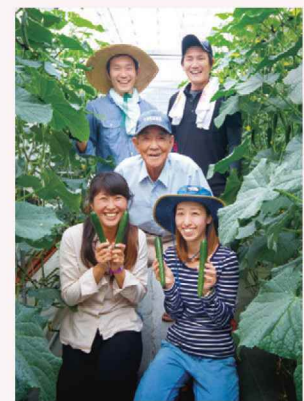
移住就農者(きゅうりタウン構想)