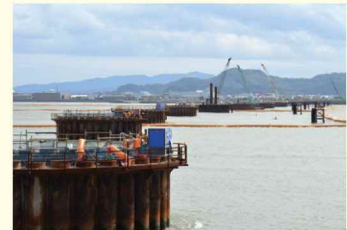
四国横断自動車道(吉野川渡河部)