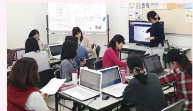
I C T ママ養成講座