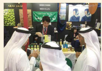
食品見本市「Gulf Food」(ドバイ)徳島ブース