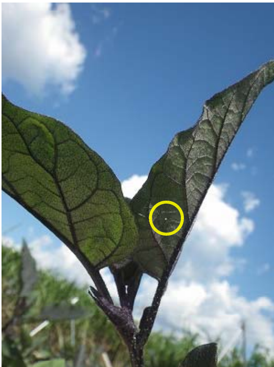
図2 ナスの上位葉に産下された卵（黄色円内）