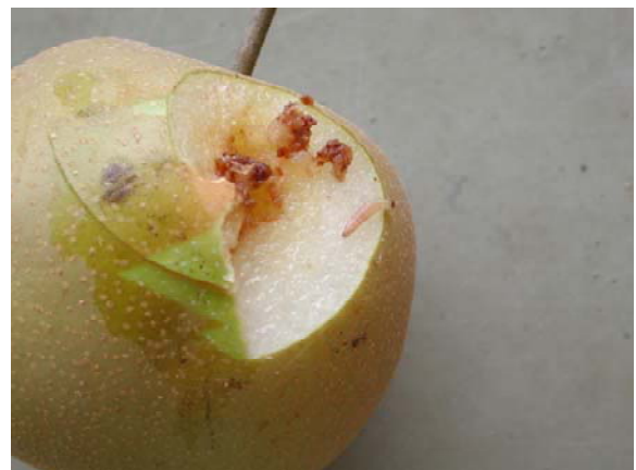
図 3 シンクイムシ類によるナシ被害果の状況（左：外観、右：内部）