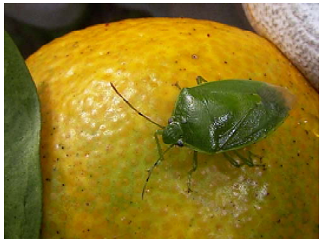
図4 ツヤアオカメムシ