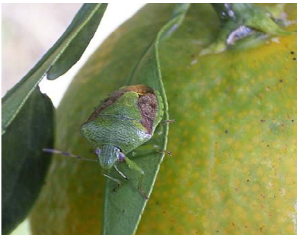
図3 チャバネアオカメムシ