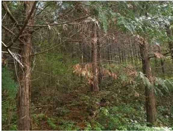
以前は木が密生したうす暗い森でした