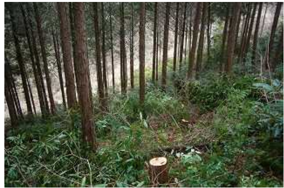
間伐することで、光が差し明るい森となりました