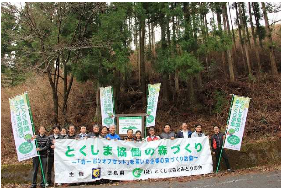
○看板前で記念撮影