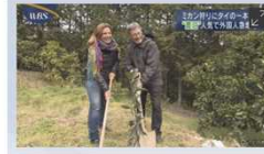
放送を見逃した方はこちら ▶