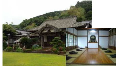
宿坊（長崎県：対馬西山寺）