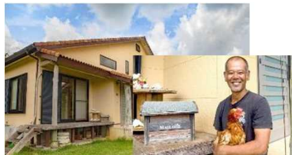
ホームステイ型（沖縄県：とるは家）