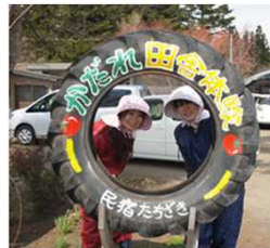
農家民泊（青森県：民宿たちざき）