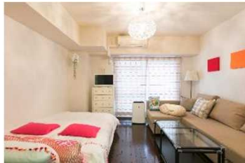
都会型（大阪市：SJアパートメント大阪・なんばA） 自社プロデュース物件