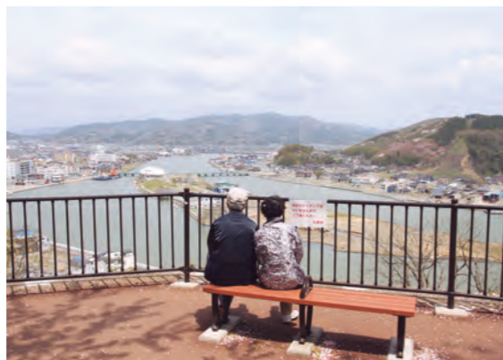
震災1年後の春 宮城県石巻市日和山公園 震災迎來首个春天 宫城县石巻市日和山公園

写真は、2011年4月1日付の紙面に掲載された瓦礫の町を背にした笑顔の子どもたち。