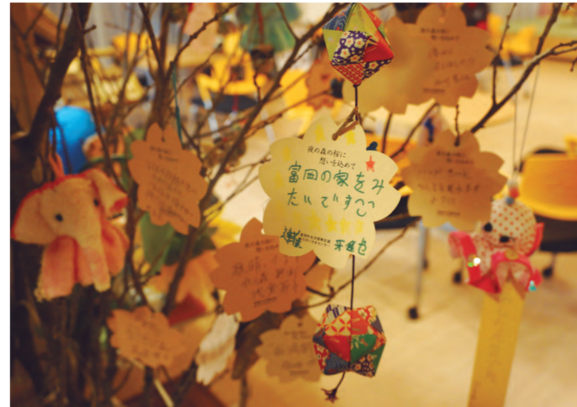
因核电站事故全町被迫避难的福岛县富冈町 富冈町生活复兴支援互助中心