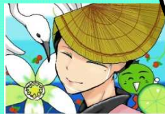
【特別支援学校生徒作品】