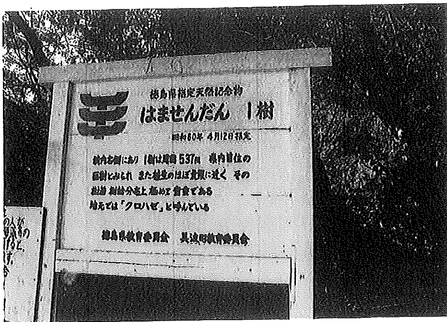
ハマセンダンの展示板