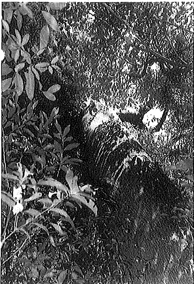
幹の下部 (ハマセンダンは広葉樹の中で生育している。)