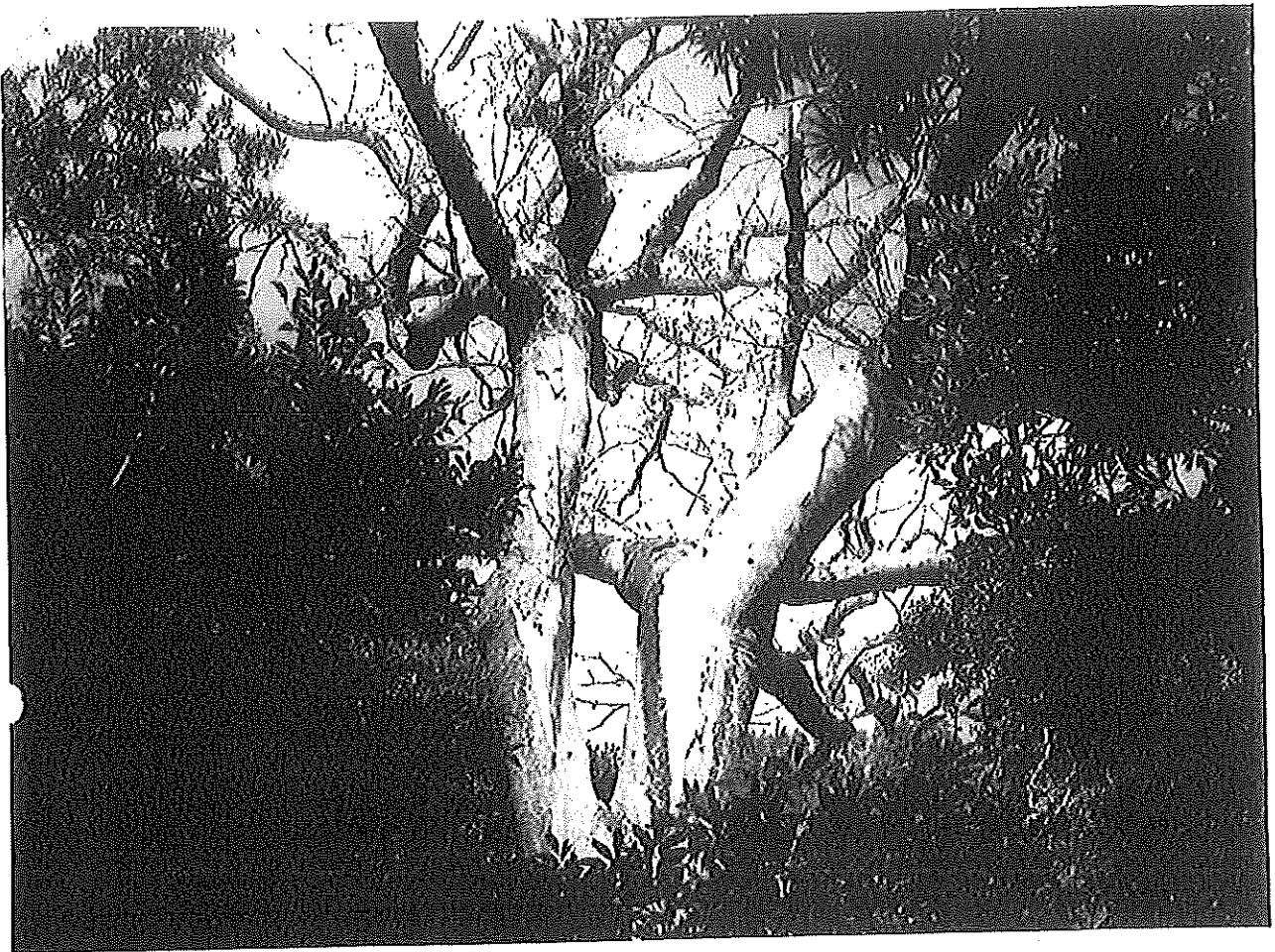
幹の上部と枝葉の状況 (わずかに葉が着生しており、幹の剥皮が目立つ。)