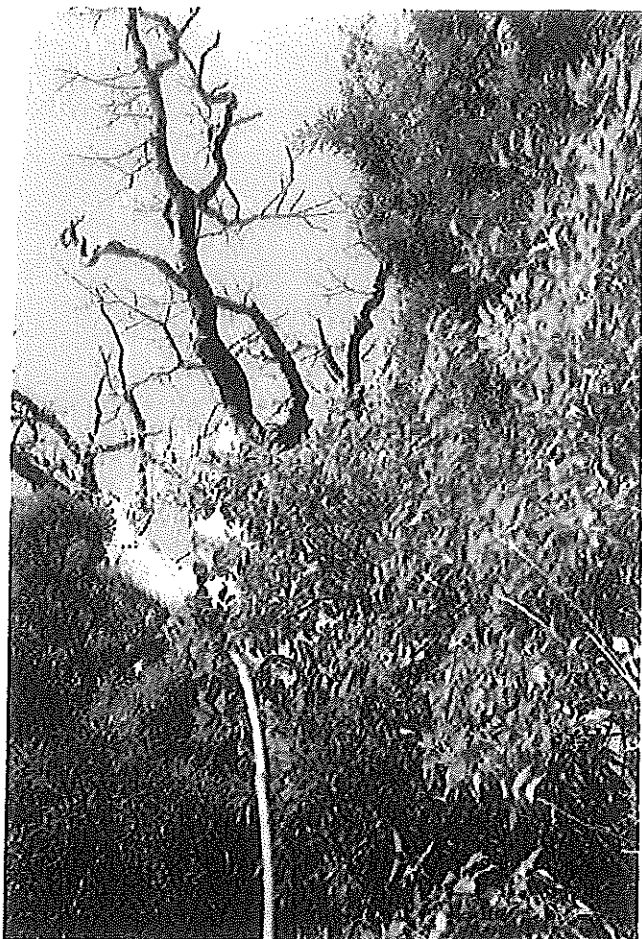
枝の状況 (梢端や枝先の枯損が目立ち、葉量が少ない。)