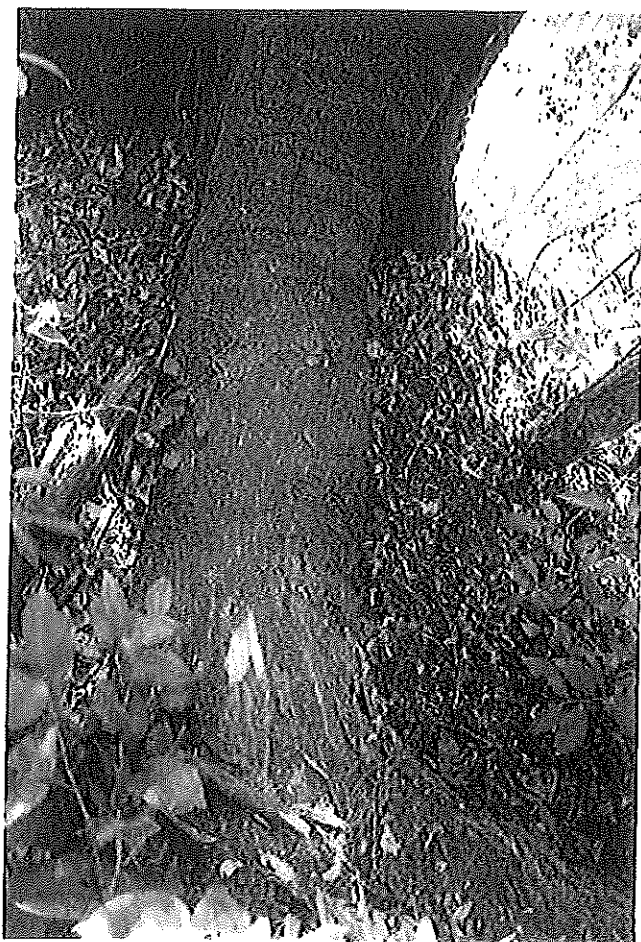
根の状況 (根株には腐朽箇所が見られる。)