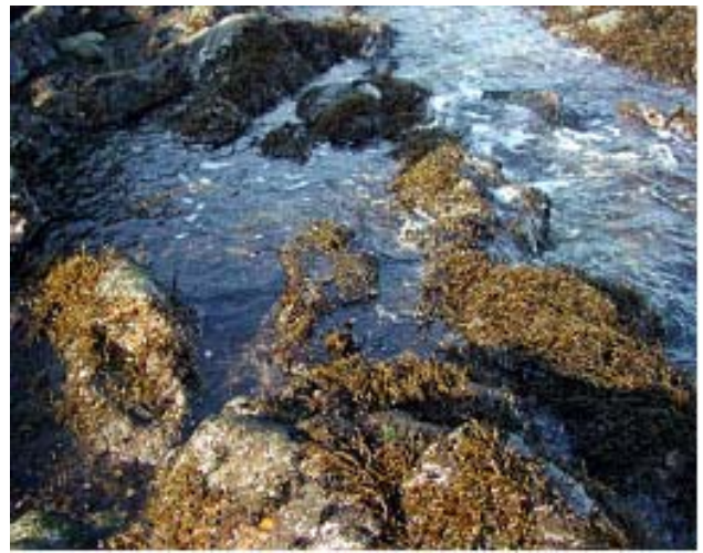
写真2 養殖試験に使用したヒジキ