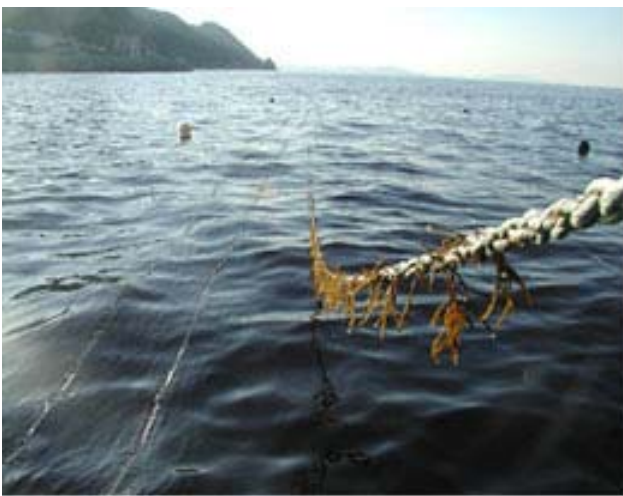
写真3 養殖セットの風景