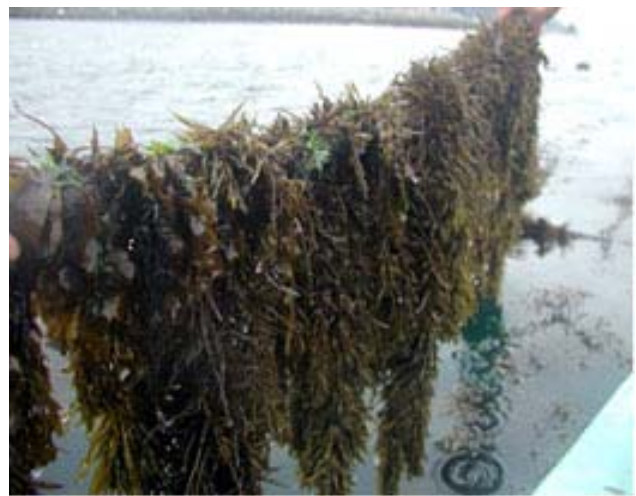
写真4 生長した養殖ヒジキ