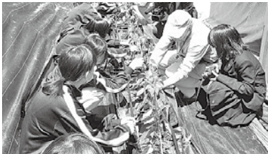
工商連携「みまから」