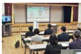
「つながルーム阿南」

URL： http://www.naruto-u.ac.jp/research/satellite/