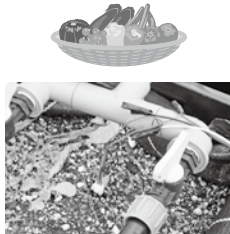
工業科製作 自動散水装置

県教育委員会では、これまでの専門教育に関する取組の成果と課題を踏まえ、次代を担う即戦力を育成することを目的として、平成27年度から31年度の5年間、本県の農業・工業・商業教育が取り組むべき新たな方針を策定いたしました。