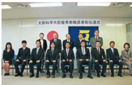
平成26年度 文部科学大臣優秀教職員表彰伝達式 (平成27年2月17日徳島県庁教育委員会にて)

平成26年度は、全国で830名、本県から公立学校関係で次の9名の方々が表彰され、2月17日(火)に表彰伝達式が県庁で行われました。