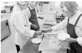
農商連携「農作物を使った商品開発」

この方針では、それぞれの活性化に向けた方策と、それに基づく、農工商連携による6次産業化に対応した実践的な取組を示しています。今後、各学校におかれましては、本方針の積極的な御活用をよろしくお願いいたします。