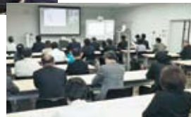
「つながルーム美馬」