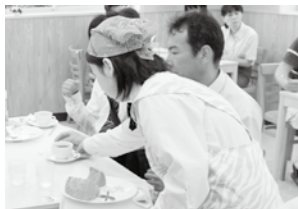
商業科「スクールカフェ」運営