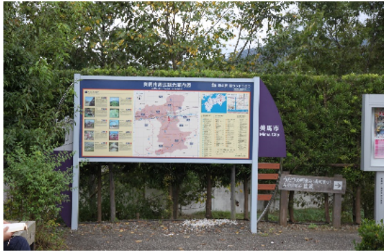
整備後 観光案内道路標識整備事業 観光案内標識