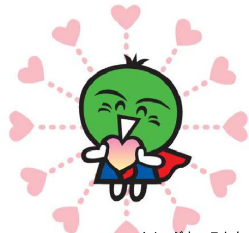
イメージキャラクター 『ココロつながるのすだちくん』