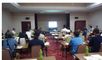
新規就農者と指導農業士の交流会