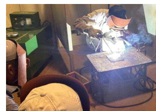
アーク溶接研修会