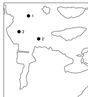
図1 - 4 水床湾調査点