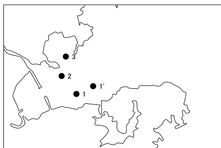
図1 - 2 浅川湾調査点