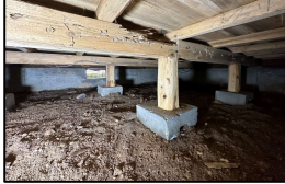
床下調査(白蟻確認)