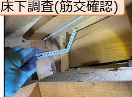
床下調査(筋交確認)