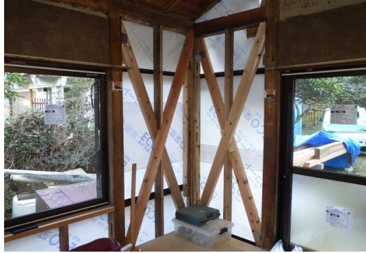
新設筋交い45×90たすき 金物I取付