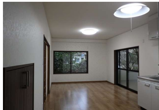
仕上げ 施工完了状況