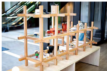
阿波指物の伝統技法が光る商品棚。

「すだちくんのお店だ!」と分かる、親しみやすい空間づくりを意識しています。すだちくんを知っている方には懐かしさや愛着を感じてもらい、まだよく知らない方にも、キャラクターショップのような楽しさを感じてもらえる場所にしたいと思いました。