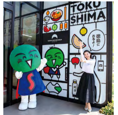
店舗の外壁に施されたフォトスポットも、国内外の観光客から注目を集めています。

「徳島が好き」と思いながら暮らすことは、日々の生活の豊かさにもつながると思います。これからも、県民の皆様と一緒にこの場所を育てながら、すだちくんを通して、徳島の魅力をさらに広げていきます。ぜひ皆様も、すだちくんショップにお越しください。