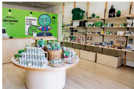
店内には、すだちくんグッズや県産品がずらり。

今回のリニューアルでは、県のマスコットキャラクターであるすだちくんを前面に出し、外から見た瞬間に