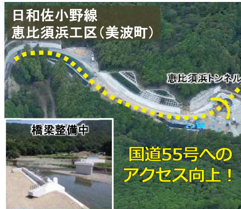
被災後の復旧・復興を担う道路整備