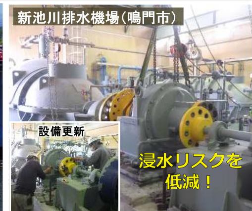
排水機場の設備更新