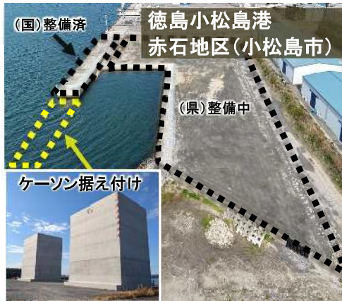
物流拠点港の岸壁延伸