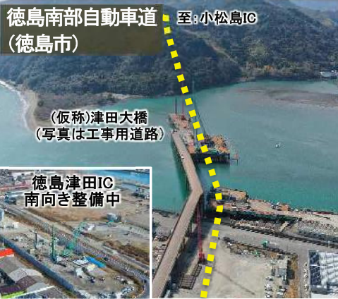
高規格道路のミッシングリンク解消