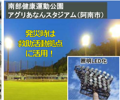
広域防災拠点の施設改修