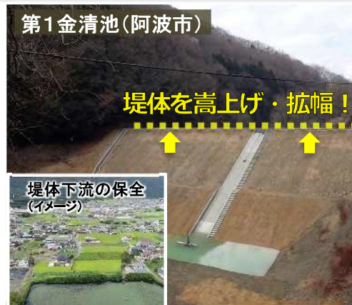
防災重点ため池の整備