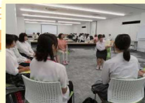
昨年度の読み聞かせボランティア養成講座