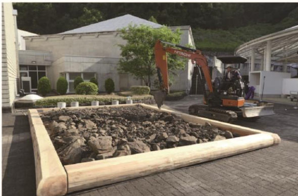
令和7年度の木枠の設置例