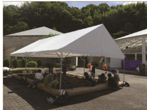
令和7年度のテント設置例（5.4m×7.2m）