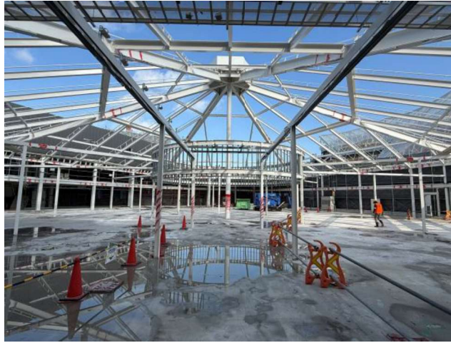
【エントランスゾーン】