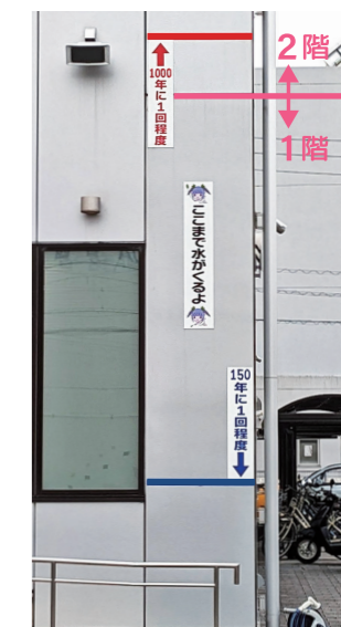
【想定されるしん水の深さを建物に示した例】

自分の家が水害の危険がある場所にある場合は、川があふれる前に安全な場所に避難できるように準備しておきましょう。