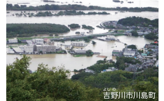
山際から吉野川のてい防までの広いはん囲が水ぼつ