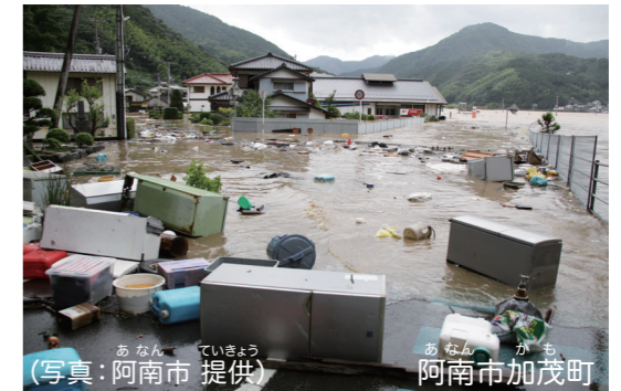
家の中まで水がおし寄せ、家電や家具が道路まで流れ出す