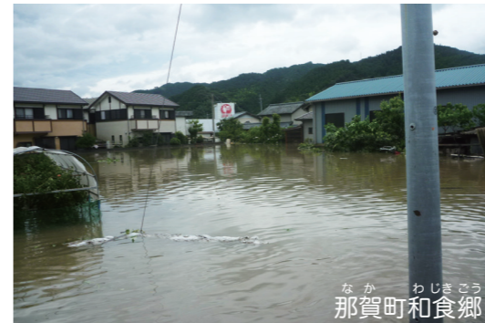
町の広いはん囲で住宅などがしん水