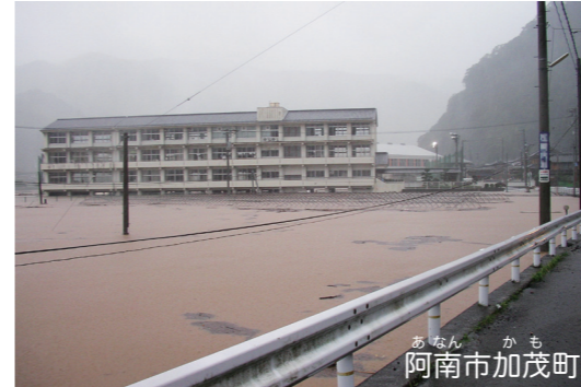
建物の1階部分が水ぼつした中学校 周辺では多くの住宅などがしん水