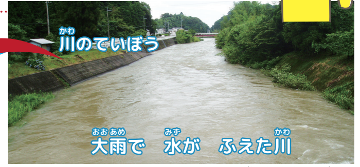
おおあめ 大雨で 水が ぶえた川