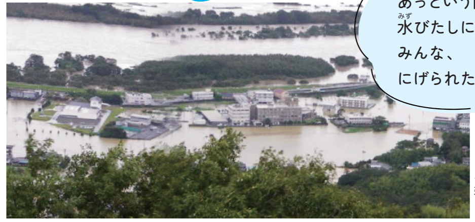
ししくいかわ かいようちようひ び はら 穴喰川(海陽町日比原)