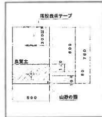
ガス配管断面 (参考図) S=1/2.5