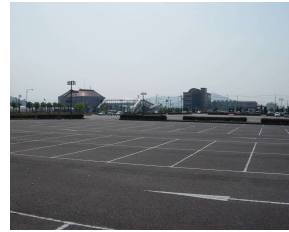
イベントスペース