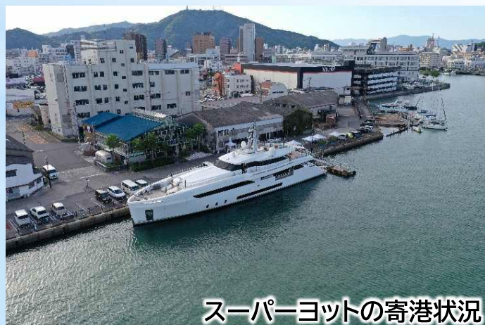
スーパーヨットの寄港状況