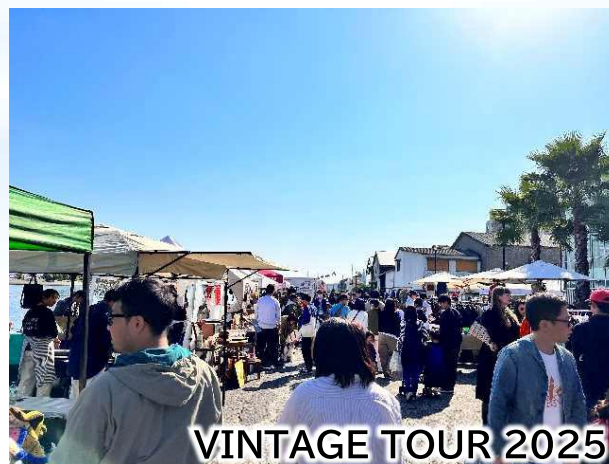
VINTAGE TOUR 2025