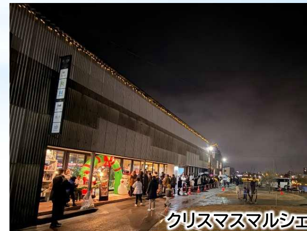
クリスマスマルシェ