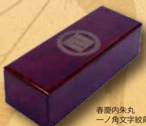
春慶内朱丸一ノ角文字紋蒔絵箱