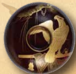
朱溜内黒鷹蒔絵椀