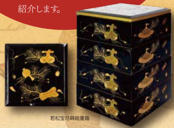
若松宝尽蒔絵重箱

(表・背面 上から) 楢総朱目出塗立丸膳、楢黒内朱足付盆 (表・前面 右上から) 若松鶴蒔絵重箱・台、鶴蒔絵椀、朱溜内黒若松蒔絵椀、松葉松遯蒔絵重箱・台、青光内朱高菊蝶絵組盆、総朱八十手・膳 (神宮寺蔵)