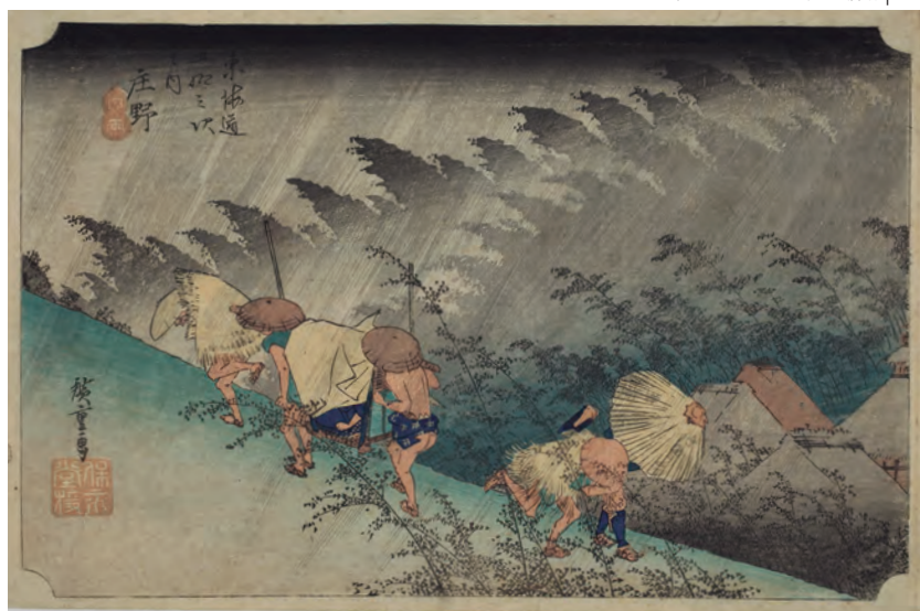
風雨の音から人々の息づかいまで、広重が描き出す臨場感 | 4