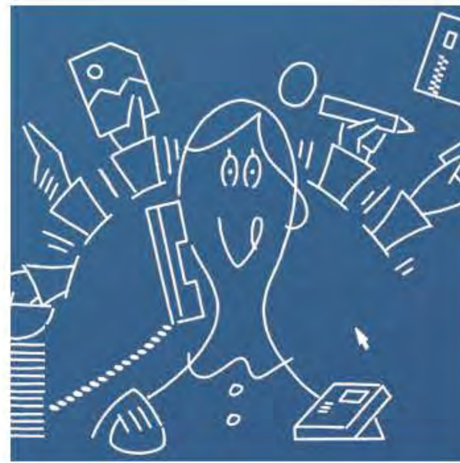
情報システム担当

PHP等の言語を使い、お問い合わせフォームや会員システムなどサイトの「動く仕組み」を構築。目に見えない裏側の処理を支える技術者として、Web制作の現場で不可欠な存在を目指します。