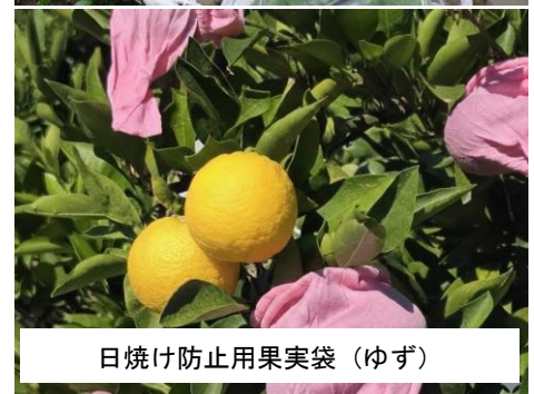
日焼け防止用果実袋（ゆず）