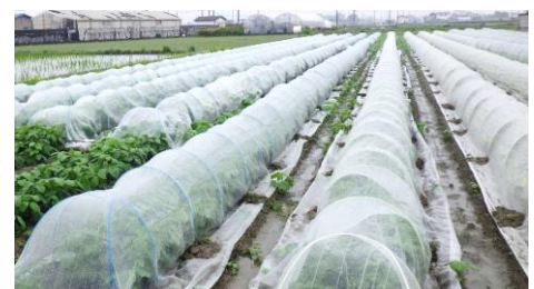
遮熱・防虫ネット（枝豆）