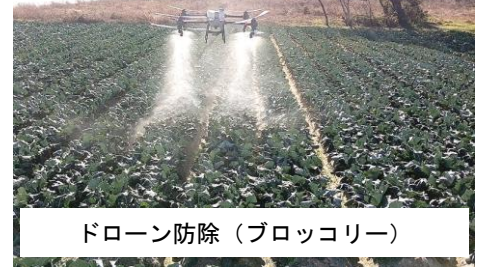
ドローン防除（ブロッコリー）