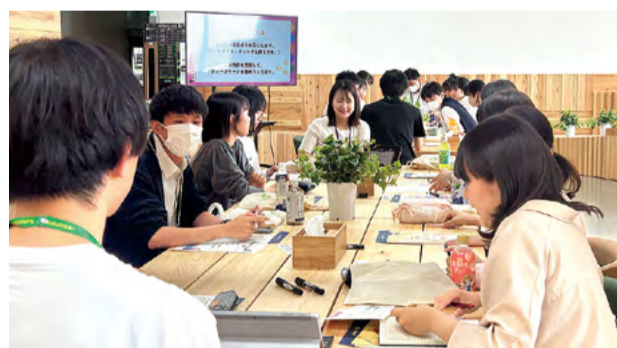
子どもの意見を踏まえた施策を着実に推進