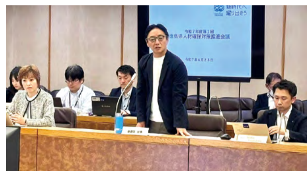
全庁を挙げた人材確保対策の推進