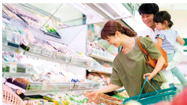
物価高への対応で生活者や事業者を支援