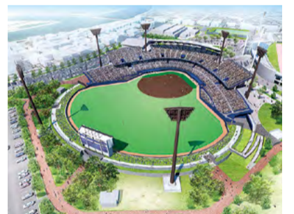
オロナミンC球場の完成イメージ

令和8年度のオロナミンC球場リニューアルに向け、プロ野球開催を可能にする本格的な競技関連備品の整備を行います。また、プロ野球の試合誘致に取り組むとともに、本県ゆかりのアスリートとの交流会、施設内覧会などのリニューアル記念イベントを開催し、新球場を核とした本県の魅力向上と交流拡大を図ります。