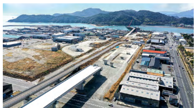
徳島津田IC(徳島南部自動車道)