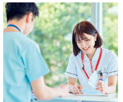
医療従事者の確保対策を推進

将来にわたって本県の地域医療を守り、地域における「持続可能な医療提供体制」を維持するため、関係機関が一丸となり、これまで以上に充実・強化した医師・看護職員・薬剤師の確保対策を展開します。