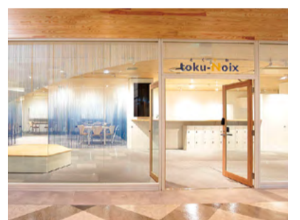
とくしまDX推進HUBとくのわ

産学官民の共創拠点として徳島駅前に創設した「toku-Noix(とくのわ)」を核に、地域課題の共有・具体化とその解決策の検討、実証実験・社会実装までを一体的に実施します。