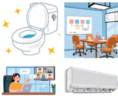
魅力ある職場環境整備補助金

労働者の多様なニーズを踏まえた福利厚生充実等により、県内の中小企業者等における人材の確保・定着に向けた取組を推進するため、「魅力ある職場づくり」や「快適な職場環境の整備」に要する経費の一部について補助を行います。