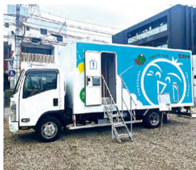
移動型車両(トイレカー)

民間事業者等におけるトイレカー等の移動型車両導入を支援し、官民が一体となって、被災者が快適な避難生活を送れるよう避難所のQOL向上を目指します。