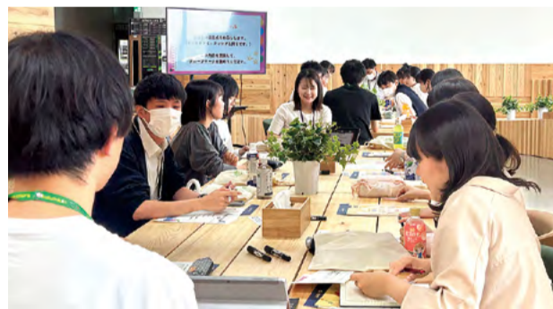
子どもの意見を踏まえた施策を着実に推進