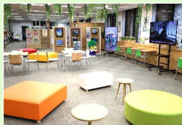
すだちくんテラス