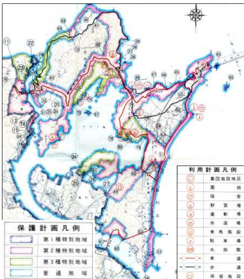
瀬戸内海国立公園及び公園計画図

鳴門公園を範囲に含む瀬戸内海国立公園は、昭和9（1934）年に国立公園に指定されている。自然公園法においては、優れた自然風景を保護するため、工作物設置や土地の形状変更、木竹の伐採等の行為に対し、規制の対象となっている。