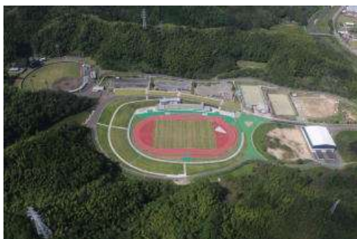
南部健康運動公園

風致の適切な維持に努め、都市の自然と美しい景観を守り、調和のとれた住みよいまちづくりを図ります。