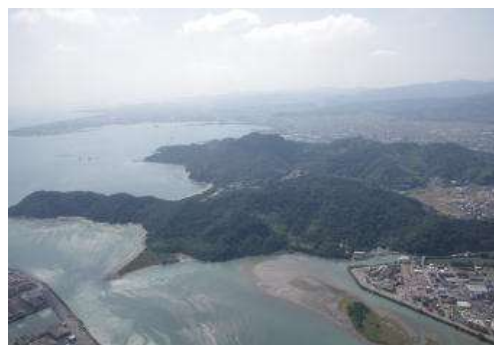
日の峰大神子風致地区