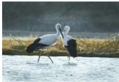
コウノトリ (写真提供：認定NPO法人とくしまコウノトリ基金)

本県では、コウノトリ足環装着プロジェクトチームによる足環装着によって、コウノトリ個体群管理に役立つ取組みを推進しています。令和6年度は、足環装着や救護用具の配置などの取組みを行い、コウノトリの保護に尽力しました。