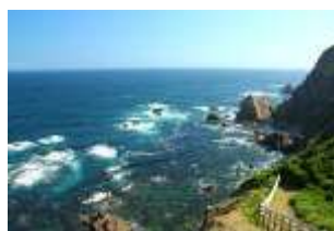
室戸阿南海岸国立公園

本県は、森林が県土の4分の3にあたる314,832haを占める森林県であり、木材生産はもとより、県土の保全、水資源のかん養、野生生物の生息や県民の保健・休息の場、そして二酸化炭素を吸収・固定し地球温暖化を抑制するなど、森林から様々な恵みを受けています。このことから、森林の有する公益的機能の保全を図るため、地域森林計画を策定し適切な管理と森林整備を進めているほか、目的別に11種類の保安林を指定しています。令和6年度末時点の指定面積は、国有林と民有林を合わせ、計117,691haとなっています。