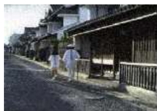
歴史的文化的街並み

貴重な動植物や地質鉱物の保護・管理のために、国や県、市町村では文化財保護法や文化財の保護に関する条例等に基づき、文化財の指定を行っています。本県では、動物 13 件（うち国指定 10 件）、植物 62 件（同 11 件）、地質・鉱物 11 件（同 4 件）の指定が行われているほか、市町村指定の天然記念物は、140 件を超えています。また、県では、16 名の文化財巡視員を配置し、その管理を図っています。