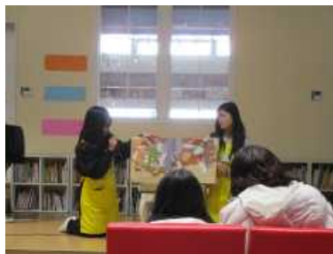
・大型絵本の読み聞かせ