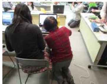
・パソコンを使った点訳体験