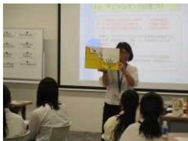
・『そしたら そしたら』で オノマトペを考えてよみあい