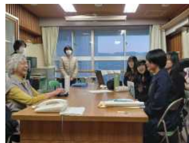
・録音ソフトの操作方法を学ぶ