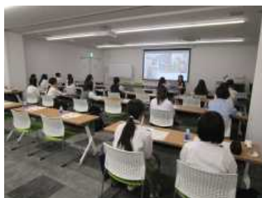
・ボランティア活動の意義について