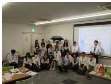
・『すてきなあまやどり』で記念撮影