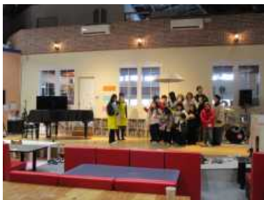
・『すてきなあまやどり』は 子どもも大人も一緒に