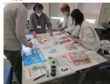
・イメージ・コラージュの進め方