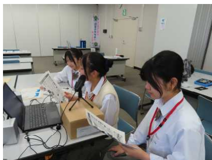
・専用ソフトを使った録音体験