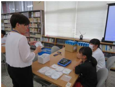
・バリアフリー図書についての説明会