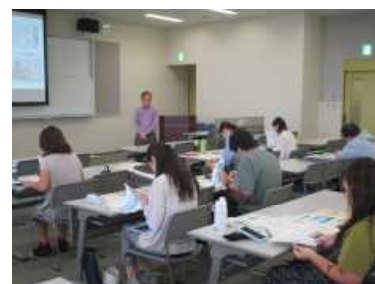
・読書の広がりや深まり