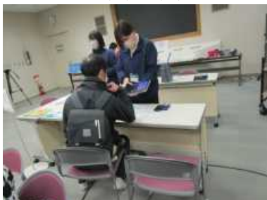
・デージー図書の説明

内容：点字絵本やデージー図書、触る絵本などでバリアフリー図書を知り、 それぞれのブースで触って体験する。