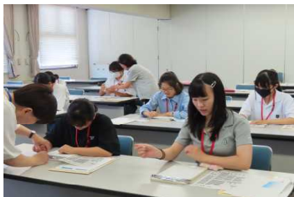
・点字盤を使った点字体験