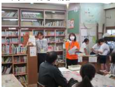
・林崎小学校での実習