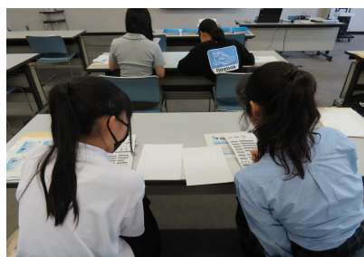
・お互いに打った点字を確認