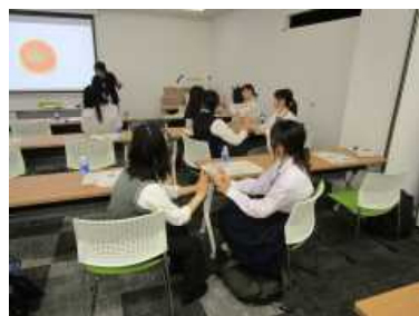
・音楽に合ながら読み聞かせ