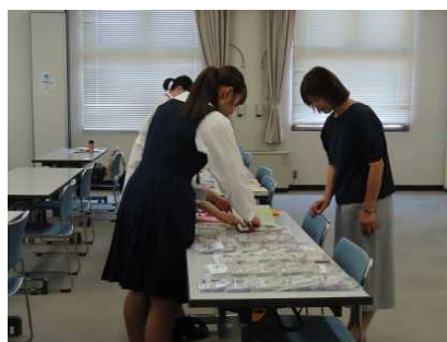
・県立図書館のバリアフリー図書を展示