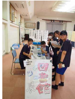
・文化祭でのバリアフリー図書展示