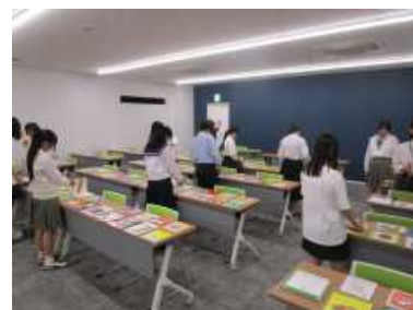
・お気に入りの1冊で読み聞かせ実演