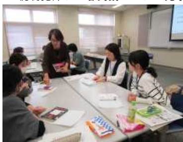
・ブックコートフィルム貼付け体験