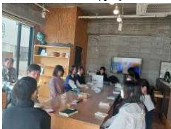
※ミーティングの様子