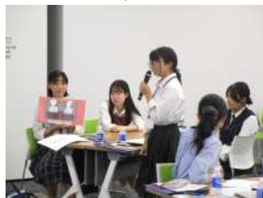
・班ごとにアニメーションを考えて発表