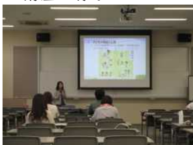
・中学生の発達と読書