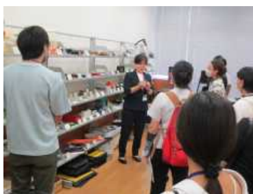
・視聴覚障がい者支援センター見学