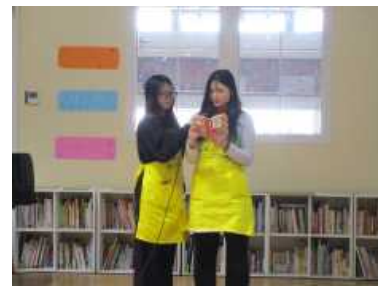
・『のはらうた』えほんクイズ