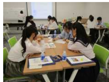
・表紙等から絵本のストーリーを想像