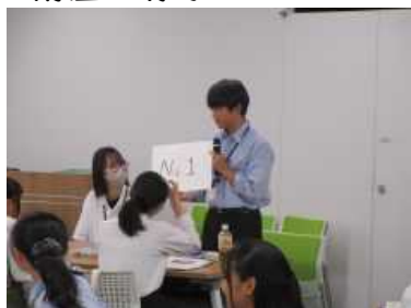
・班の名前をみんなで考えて発表