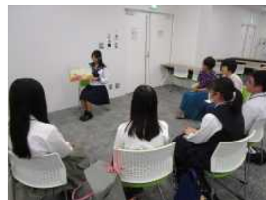
・次回の実践に向けての絵本選択