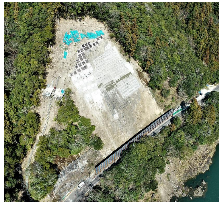
進捗状況写真 令和8年4月現在