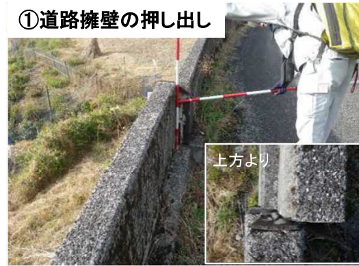
①道路擁壁の押し出し